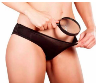
Map Estética Íntima